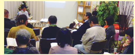
※写真は「PBA/パートナー祈り会」の様子です。

連絡先: 電話 03-3295-4921 E-mail mail@pba-net.com