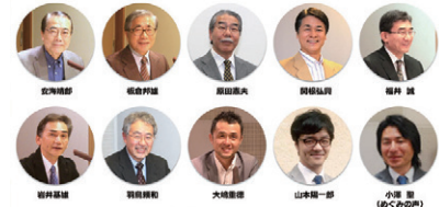
さまざまな教団牧師、年代の牧師が担当しています。