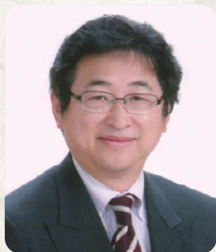
東京ホープチャペル 牧師